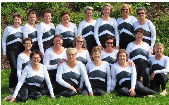
Dametroppen i Haugesund – sommer 2017